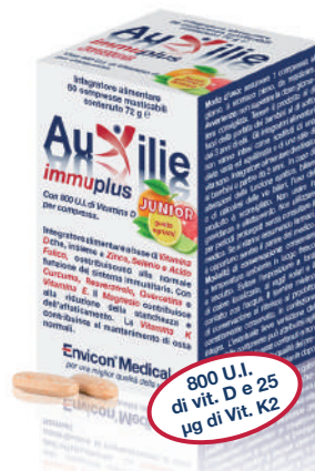
AUXILIE® IMMUPPLUS JUNIOR SOLUBILE