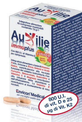
AUXILIE® IMMUPPLUS JUNIOR SOLUBILE